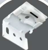
Кронштейн для римской шторы пружинный