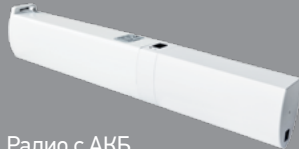
Радио с АКБ